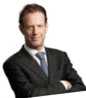
Par Christian Lüscher

LA DROITE GENEVOISE S'ALLIE POUR LE SECOND TOUR DE L'ÉLECTION AU CONSEIL D'ÉTAT : LES ASSEMBLÉES DES PARTIS DE DROITE ONT DÉCIDÉ D'UNE ALLIANCE STRATÉGIQUE ENTRE LE PLR, LE CENTRE, L'UDC ET LE MCG. CHRISTIAN LÜSCHER, CONSEILLER NATIONAL ET RESPONSABLE DU COMITÉ ÉLECTORAL, NOUS EN EXPLIQUE LES ENJEUX.