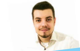
Par Gabriel Delabays

Chaque mois, le Nouveau Genevois vous propose un panorama (presque) exhaustif des projets PLR encore pendants devant le Grand Conseil. Les nouveaux projets apparaissent en couleur . Nous ne manquerons pas, dans ces colonnes, de vous tenir informés des suites données à ces différents textes. Retrouvez-les aussi, de même que les projets déjà adoptés et le programme complet du parti, sur plr-ge.ch .