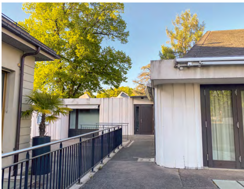
Salle communale (étude en cours)

L'entretien des bâtiments, c'est surtout prévoir, imaginer et projeter le futur . C'est pourquoi des projets