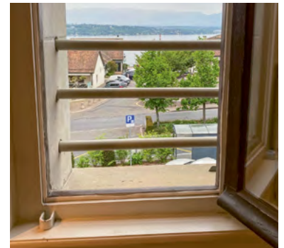
Centre Culturel du Manoir – CCM

Pose d'une main-courante sur le garde-corps en bois