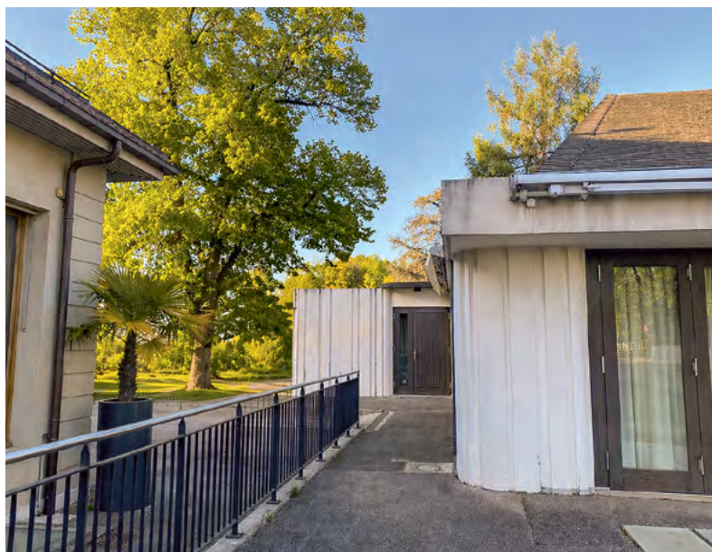
Demain – nouvelle perspective sur le parc et la villa Chesner