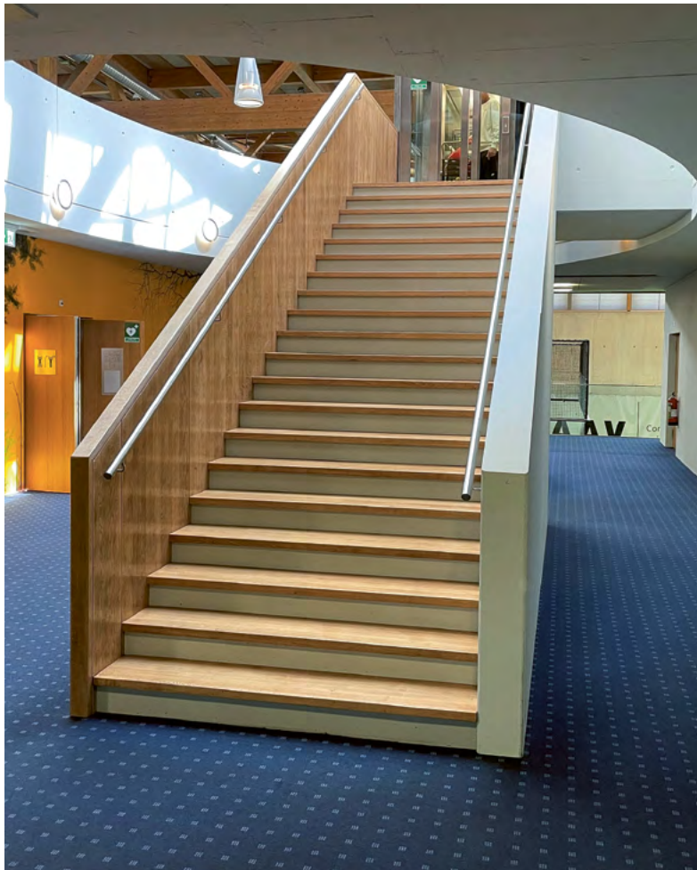
Centre Sportif de Cologny – CSC

Pour conclure, la commission de l'entretien des bâtiments se réjouit d'accueillir en son sein un nouveau bâtiment communal, à savoir une «ancienne dépendance d'un grand domaine», plusieurs fois transformée et connue pour les moins jeunes sous le nom de «Pavillon de Ruth»... affaire à suivre!