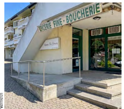
Epicierie au Chemin de la Mairie, 1 (étude en cours),

Rajout de deux barres en dessus et en dessous de la barre existante du milieu. Mise aux normes pour éviter le risque de chute.