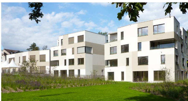
Crèche de la Louchette de 63 places à côté de logements communaux.

Nous veillerons au bon développement du service social durant cette législature. Il convient de soutenir les Colognotes, quel que soit leur âge, qui rencontrent des difficultés. Ainsi, les allocations logement ont été augmentées, des cartes du service taxi pour les aînés sont distribuées, des aides ponctuelles pour les devoirs peuvent être fournies. Il convient de tout entreprendre pour aider les