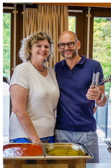
Le réconfort après l'effort.

Ce tournoi de pétanque a confirmé que la Villa Chesner n'est pas seulement un nouvel espace sportif, mais aussi un véritable lieu de rencontre et de lien social à Cologny. Entre compétition amicale, plaisir du jeu et moments de partage, cette journée restera dans les mémoires comme un bel exemple de convivialité locale.