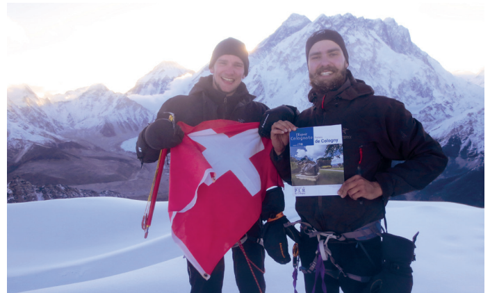
L'Esprit Colognote au sommet du Lobuche Peak (6'119m) en face de l'Everest et du Nuptse. 11 mai 2017, 5h du matin.