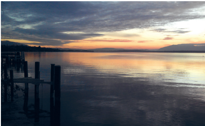
"Sunset and midnight bath"