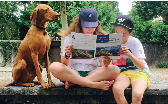
"Happy in Cologny"